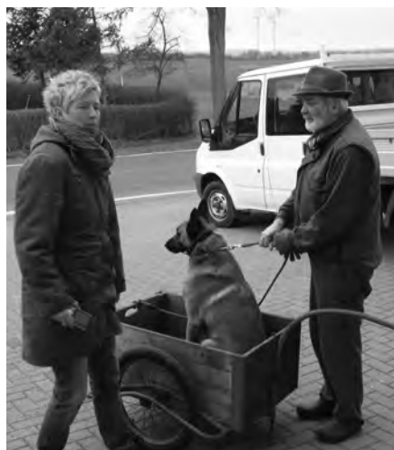
Aber auch der Spaß kam nicht zu kurz: Keine Angst, der Hund kommt nicht auf den Müll!!