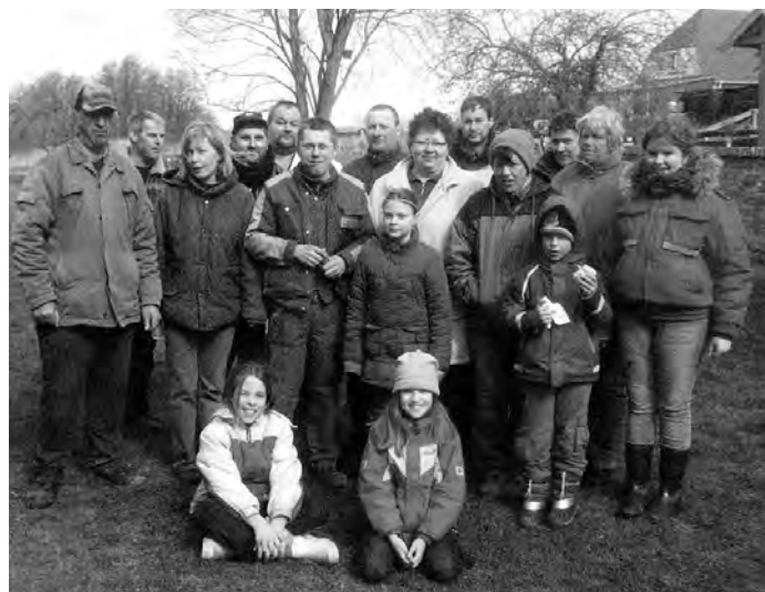
Die (nicht mehr ganz vollständige) Krempiner Mannschaft nach getaner Arbeit am Gemeindebackofen.