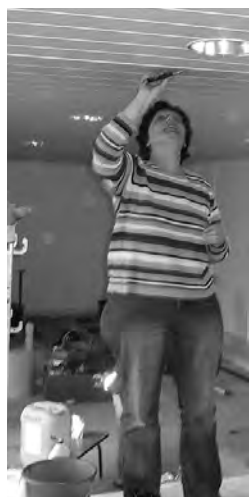
Und diese akrobatische Einlage wurde ganz un-fallfrei absolviert.