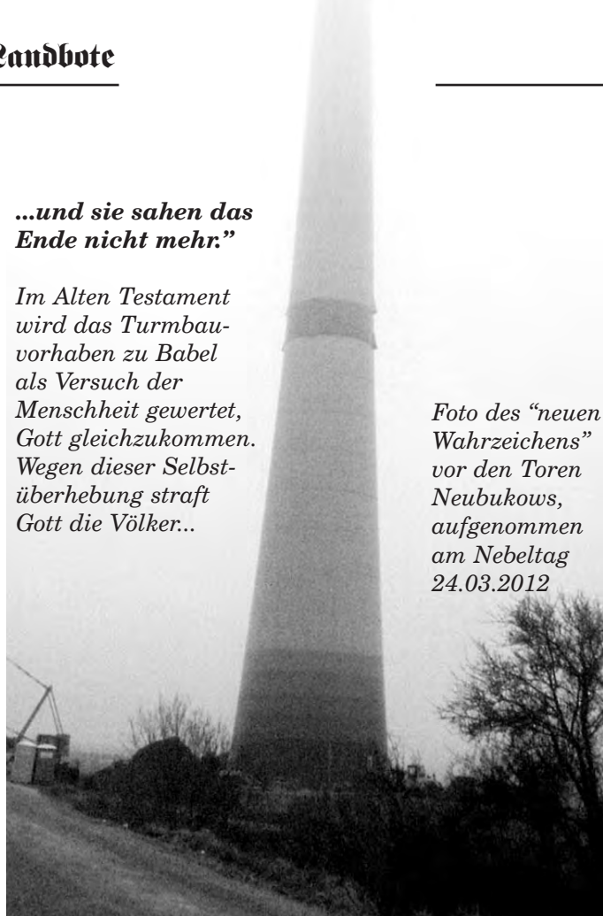
Foto des "neuen Wahrzeichens" vor den Toren Neubukows, aufgenommen am Nebeltag 24.03.2012

Wer es noch nicht begriffen hat: Es geht ums Geld. Und da denken viele Menschen nur an sich. Was zählen da ein paar Bürger in einem kleinen Dorf.