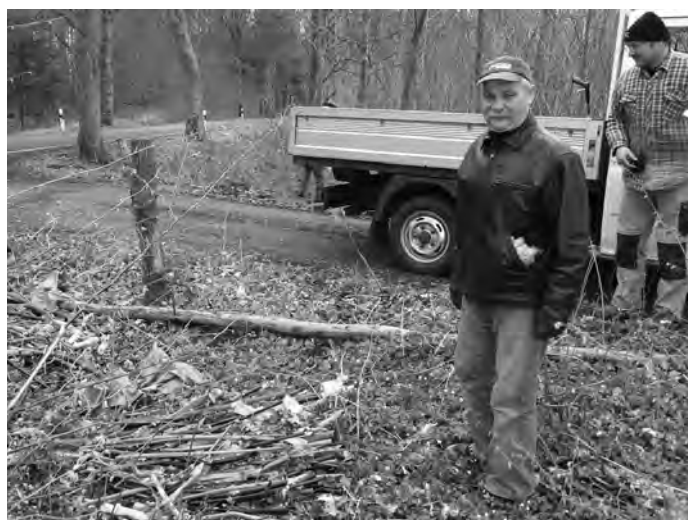
Unverständnis bei den Helfern: Wer schmeißt Müll in unsere Umwelt? Hängerweise wurde er zu den Sammelstellen gefahren.

Ich danke allen Helfern für die Bereitschaft und tatkräftige Unterstützung! Während meiner Besucher- runde freute ich mich riesig über Ihre Initiative. Ich finde es immer wieder eine gute Sache. Alle, die da- bei waren, sind Vorbild für viele. Sie leisten einen Beitrag für ein schöneres Umfeld und für die Um- welt. Sie helfen uns als Gemeinde mit Ihrem Beitrag sehr. Danke.