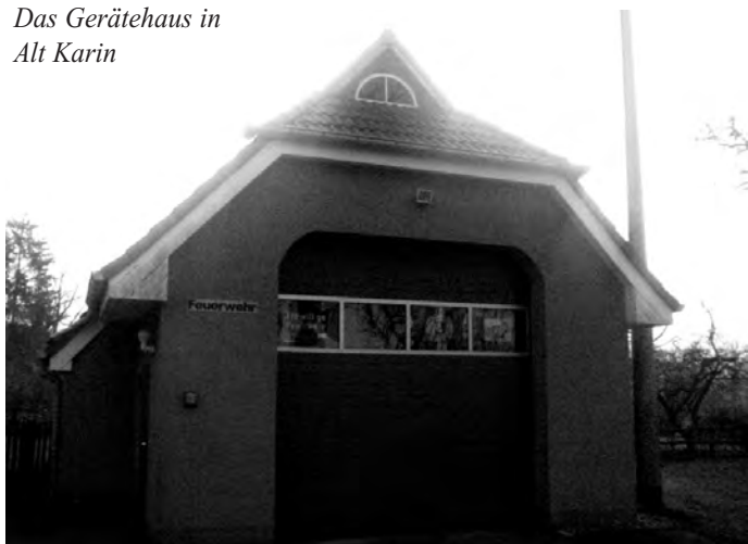
Das Gerätehaus in Alt Karin